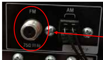
図1 機器の同軸端子